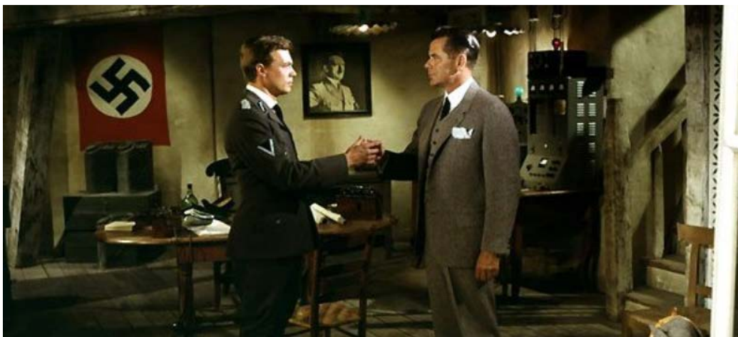
Los cuatro jinetes del Apocalipsis – Vincente Minnelli (1962)