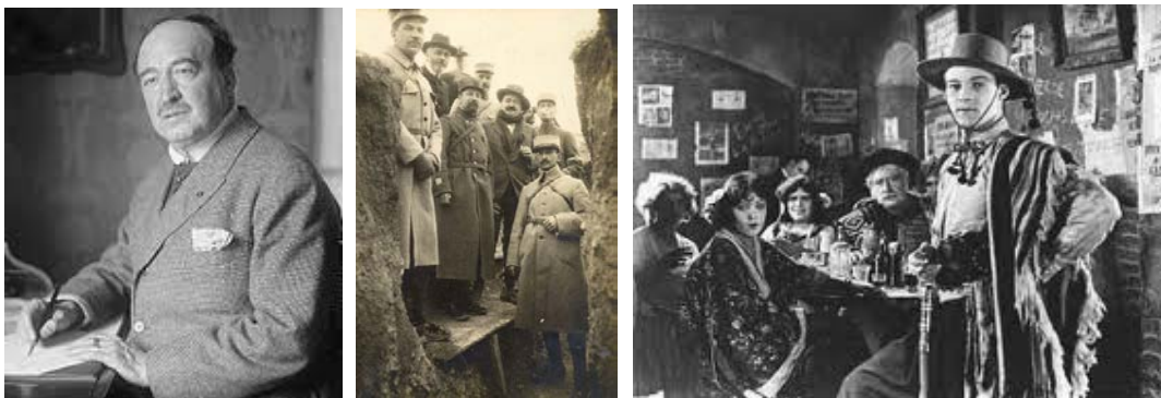
Blasco Ibáñez – Frente del Marne 1915 – Los cuatro jinetes del Apocalipsis (1921)

Minnelli, maestro de películas inolvidables, director sublime, conciliador de una saga familiar canora y talento interpretativo (Judy Garland y Liza Minnelli), investigador del color y del espectáculo cinematográfico, alcanza uno de sus zenit creativo con la novela de Blasco Ibáñez. La suma de estos dos talentos, Blasco Ibáñez y Minnelli, que no coincidieron en el tiempo, pues Blasco Ibáñez fallece en 1928, ha dado una de las obras más representativas del melodrama bélico, junto a “Adiós a las armas” basada en la novela de Ernst Hemingway escrita en 1929, y dirigida en 1932 por Frank Borzage y en 1957 por Charles Vidor y John Huston.