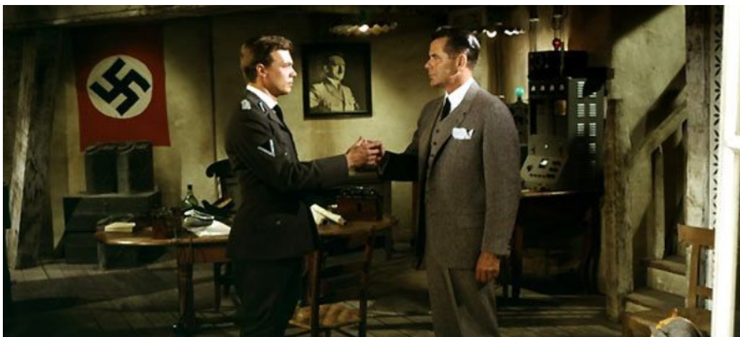
Los cuatro jinetes del Apocalipsis – Vincente Minnelli (1962)