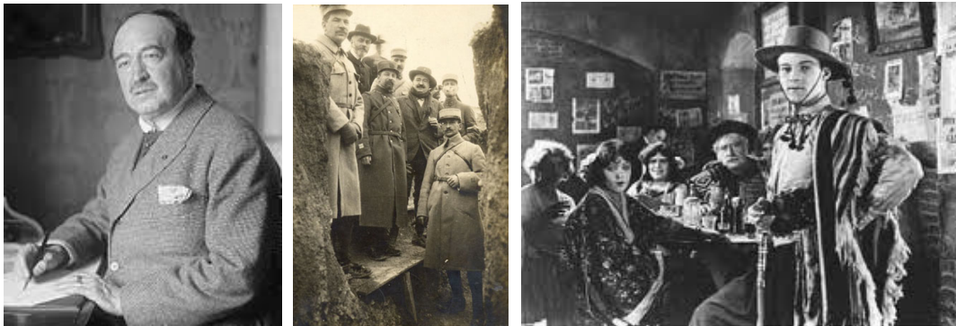
Blasco Ibáñez – Frente del Marne 1915 – Los cuatro jinetes del Apocalipsis (1921)

Minnelli, maestro de películas inolvidables, director sublime, conciliador de una saga familiar canora y talento interpretativo (Judy Garland y Liza Minnelli), investigador del color y del espectáculo cinematográfico, alcanza uno de sus zenit creativo con la novela de Blasco Ibáñez. La suma de estos dos talentos, Blasco Ibáñez y Minnelli, que no coincidieron en el tiempo, pues Blasco Ibáñez fallece en 1928, ha dado una de las obras más representativas del melodrama bélico, junto a “Adiós a las armas” basada en la novela de Ernst Hemingway escrita en 1929, y dirigida en 1932 por Frank Borzage y en 1957 por Charles Vidor y John Huston.