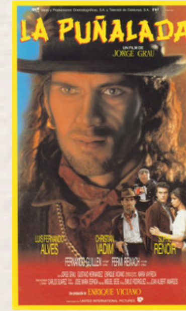
La puñalada Jorge Grau. 1989