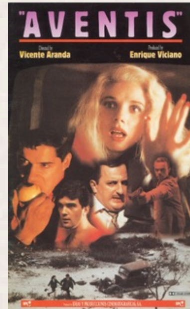
Si te dicen que caí... Vicente Aranda. 1989