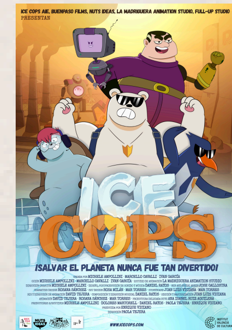
Ice cops Paola Tejera. 2024.