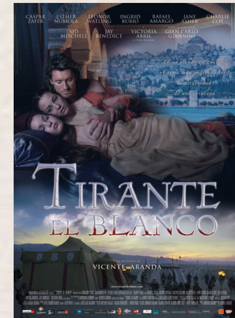
Tirante el blanco Vicente Aranda. 2006.