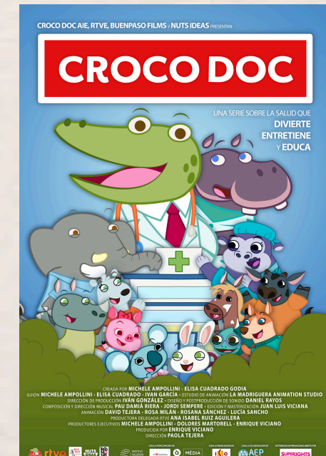
Croco Doc Paola Tejera. 2021