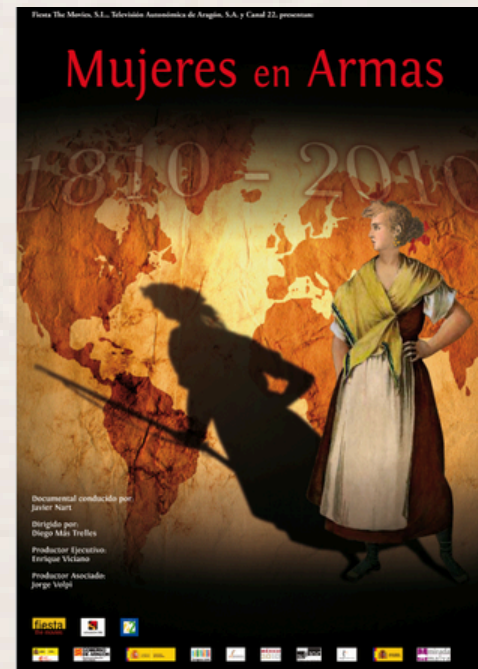
Mujeres en armas Diego Más. 2009.